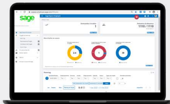
Sage Espace Employés - Congés et Absences